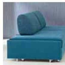
Rückenlehne Typ 2