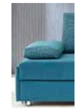
Seitenkissen Typ 10