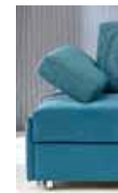
Armlehne Typ 7 (verstellbar)