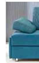
Armlehne Typ 8 (verstellbar)