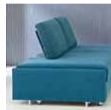
Rückenlehne Typ 9