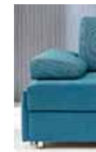
Armlehne Typ 6