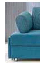
Armlehne Typ 3