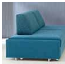
Rückenlehne Typ 1