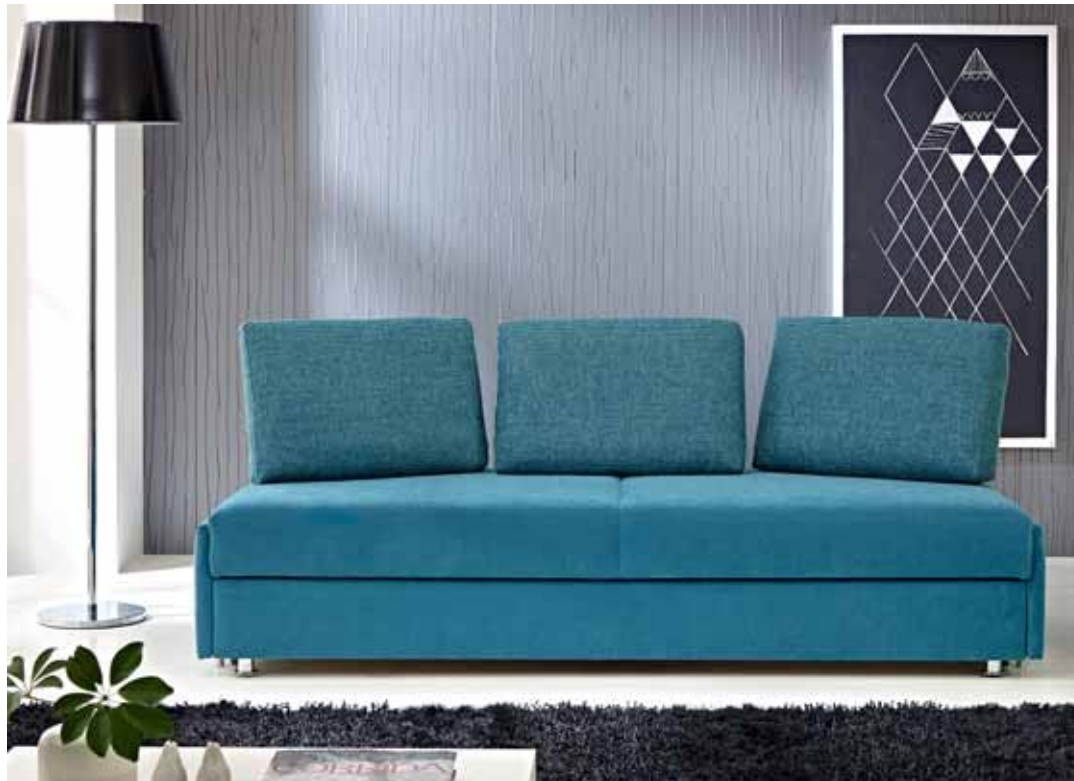
Rückenlehne Typ 9 – eine Lehne, viele Möglichkeiten