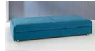
Einzelliege mit Bettkasten, Liegefläche 90 x 200 cm