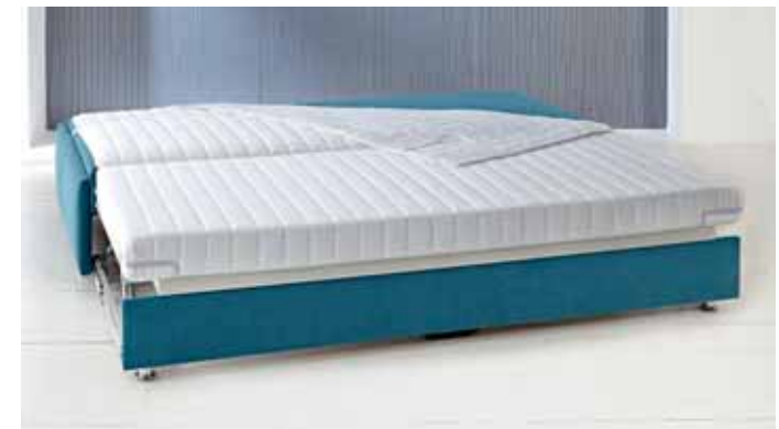
Schlafsofa ohne Bettkasten, Liegefläche 180 x 200 cm