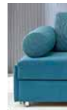
Armlehne Typ 4