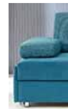
Armlehne Typ 5