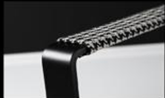
Einzelsessel im Bezug Classy black