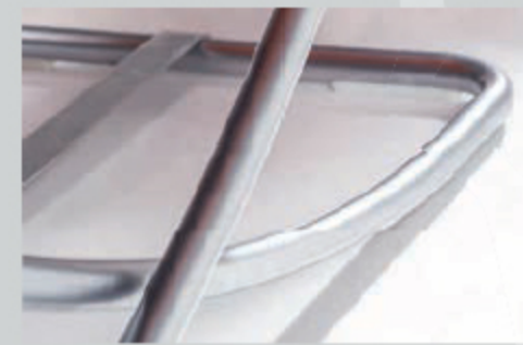
Untergestell silber pulverbesch., F C6 metal frame silver powder-coat., F C6