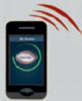
FAPP App-Steuerung für Motor app control for motor