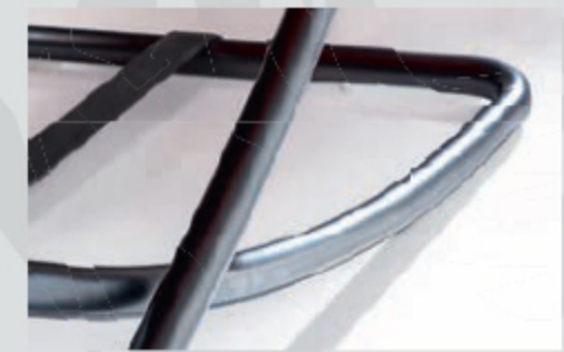
Untergestell schwarz pulverbesch., F C7 metal frame black powd.-coat., F C7

Die Untergestelle können in verschiedenen Farben bestellt werden. Bitte geben Sie die gewünschte Optik bei Ihrer Bestellung mit an. Das Untergestell wippt leicht.