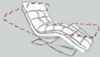
KF75K Liege chaise 75/152/108/52